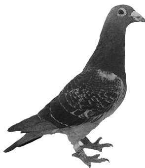
023-97-1260. Delbar avlshan. Søn af 783. Placeringer: 1, 15, 17 og 19 osv. som et-års.