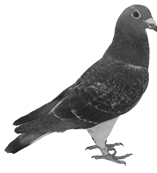
023-99-461. "Screwdriver", søn af 1260. Placeringer: 2, 4, 5, 10, 19, 27, 39 og 44 osv. Syvende bedste esdue i DdB 2001.