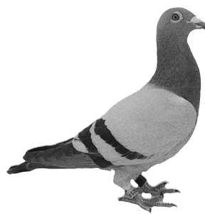
023-99-475. Søn af 1169. Placeringer: 2, 3, 5 og 15 osv.