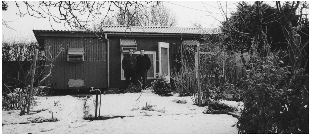
Slaget ligger lidt indelukket i forældrenes baghave.