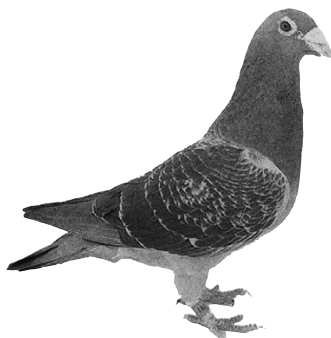
022-91-783. Delbar stamhan.