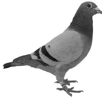
Belge 99-3247. Import fra Belgien. Placeringer: 1, 2, 12, 26, 43 og 45 osv.