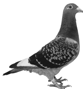
023-00-534. Barnebarn af 1169, sektionvinder Soltau den 7/7.